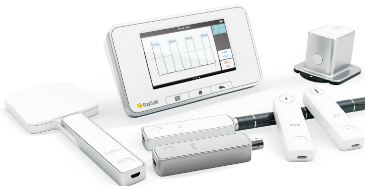
Sistema RaySafe X2 que incluye: Unidad Base, R/F, MAM, CT, Volt, Light, mAS y Survey.